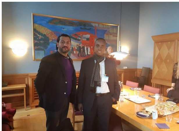
Workshop på Rådhuset

IRNs initiativ til å registrere Islamofobi og hetsing av muslimer ble også diskutert.