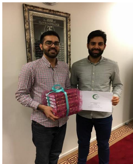
IRN Ungdomsansvarlig sammen med leder fra ICC Ungdom (høyre)

Den aller første IRN Ungdomspris for 2016 ble gitt til ICC Ungdom for deres innsats på dialogfronten og deres inkluderende representasjon av alle muslimer.