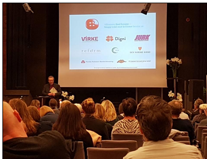
Bildet fra konferansen

IRN er stolt av å være en del av «Rød-knapp» alliansen.